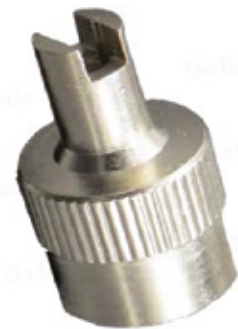
Outil de tige de valve