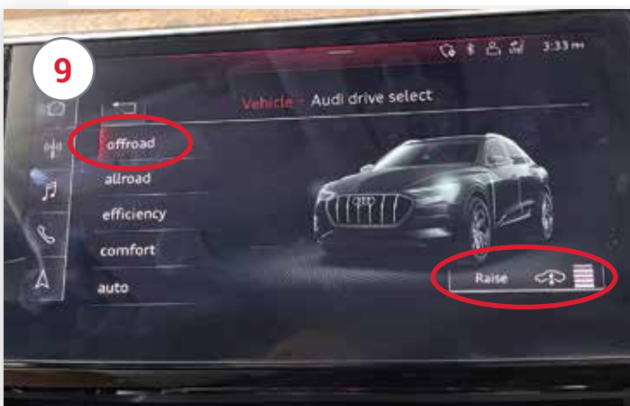
Dans l'écran infodivertissement, sélectionnez le réglage le plus élevé « Offroad ».

Pour désactiver la fonction Roue libre, remettez le véhicule en position de stationnement en appuyant sur le bouton « Park » du levier de vitesses.