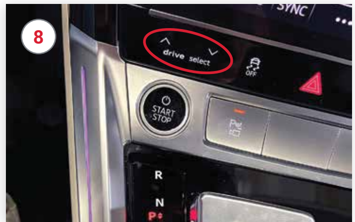
Pour élever le véhicule avant de le charger, appuyez sur le bouton « haut » de « Drive Select »