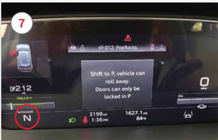
Le tableau de bord indique neutre (N)

Mettez le véhicule au point mort en glissant le levier de vitesses vers vous