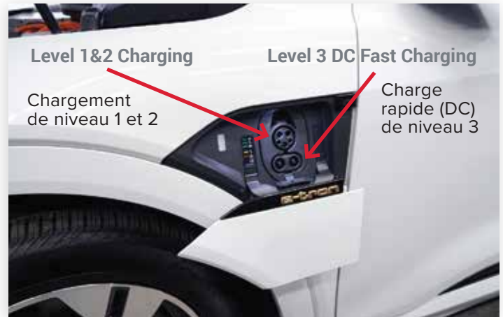
Trappe de recharge côté conducteur Charge rapide de niveau 1/2 et de niveau 3 en courant continu