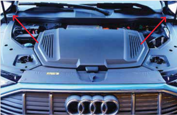
Déverrouillages manuels de la trappe de recharge et du câble de charge se trouvent dans la zone du capot de chaque assemblage du port de charge