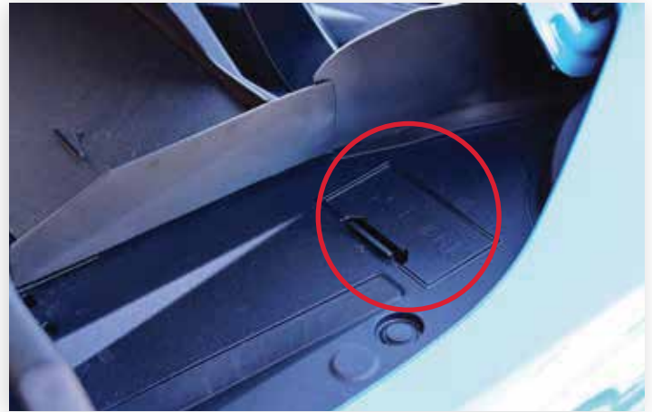
Retirez le couvercle