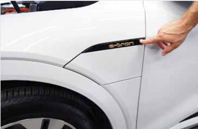
Appuyez sur le bouton pour ouvrir la trappe de recharge côté conducteur