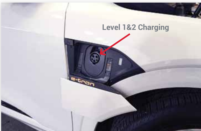
Trappe de recharge côté passager, si équipé Niveau 1/2 uniquement