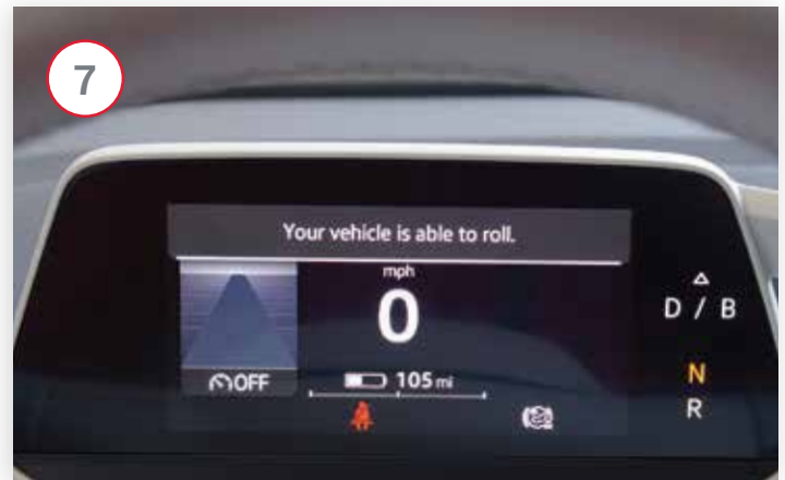
Le groupe d'instruments indique également que le véhicule est maintenant capable de rouler.

Pour désactiver la fonction de roue libre, remettez le véhicule en stationnement en appuyant sur le bouton de stationnement (Park) du levier de vitesses.