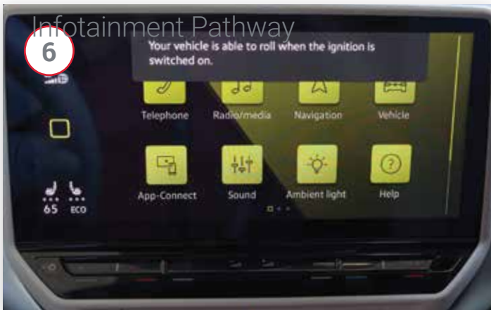
L'écran d'infodivertissement indique que le véhicule est maintenant capable de rouler.