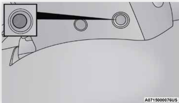
Port d'accès de neutralisation du sélecteur de rapport