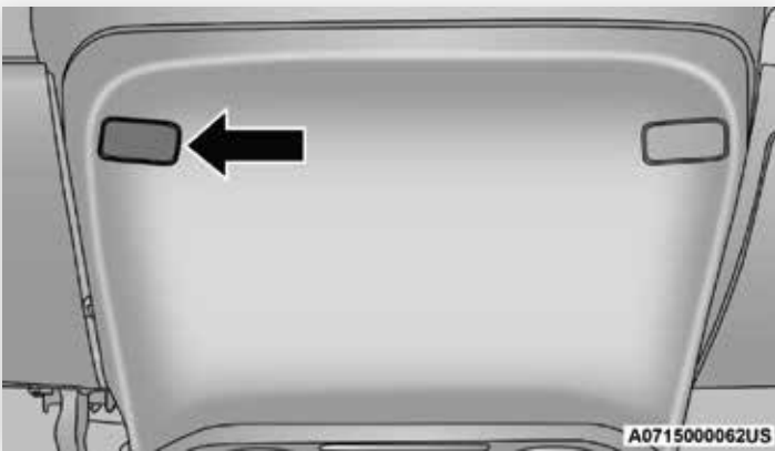
Couvercle du levier de déverrouillage de sélecteur de rapport