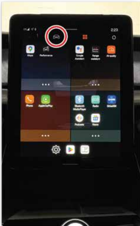
Sur l'écran central, sélectionner l'icône « véhicule »