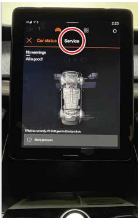
Sélectionner « Service »