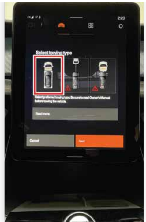
Sélectionner l'icône pour chargement sur remorque plateforme (Rollback Towing)