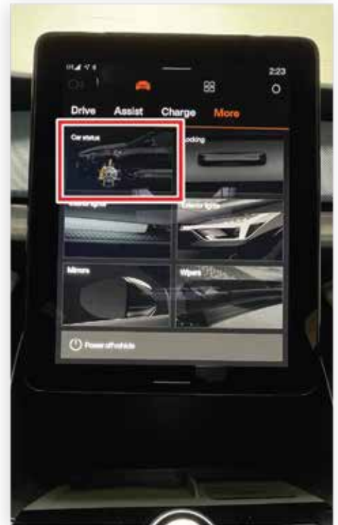
Sélectionner l'état du véhicule (Car Status)