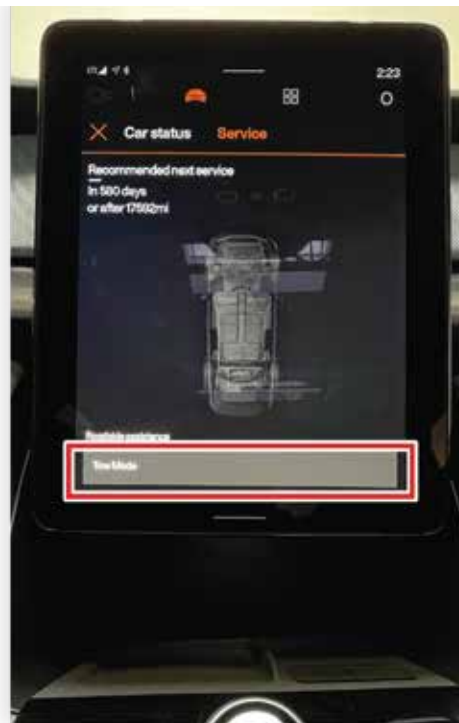
Sélectionner la mode de remorquage (Tow Mode)