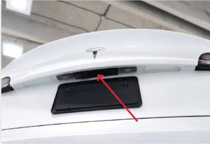
Interrupteur du coffre arrière