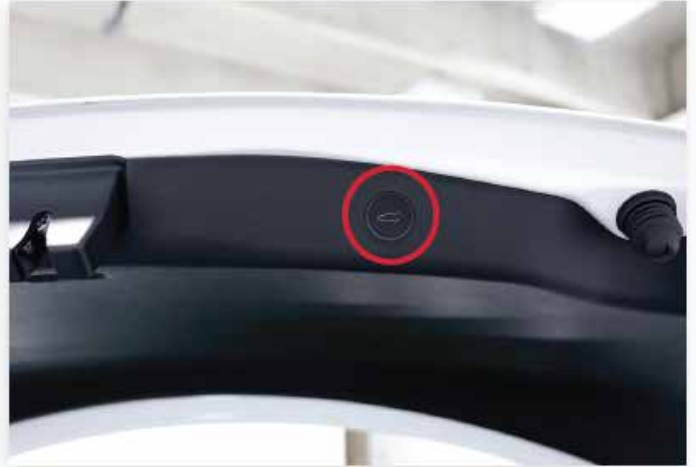
Interrupteur intérieure du coffre arrière