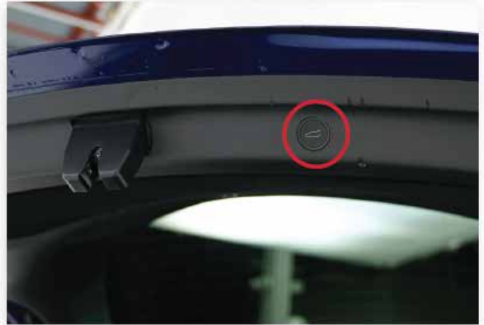
Interrupteur intérieure du coffre arrière