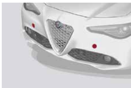
Emplacement des bouchons d'œillet de remorquage avant