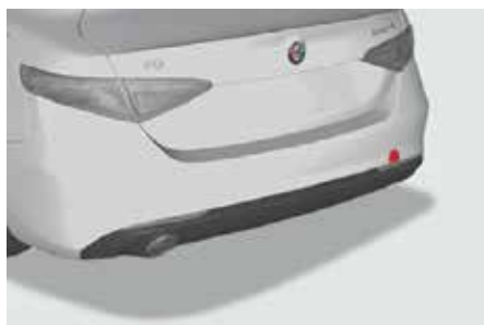
Emplacement des bouchons d'œillet de remorquage arrière